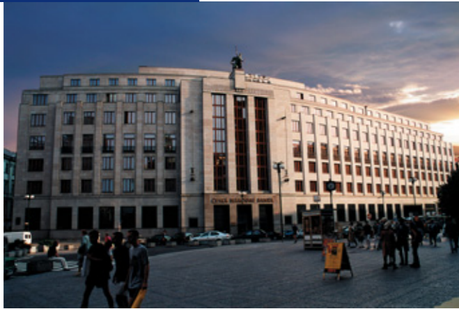
Současné sídlo České národní banky a pobočka Praha v ulici Na Příkopě