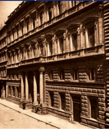
Budova první pobočky NBČ v Bredovského ulici – dnes ulice Politických vězňů